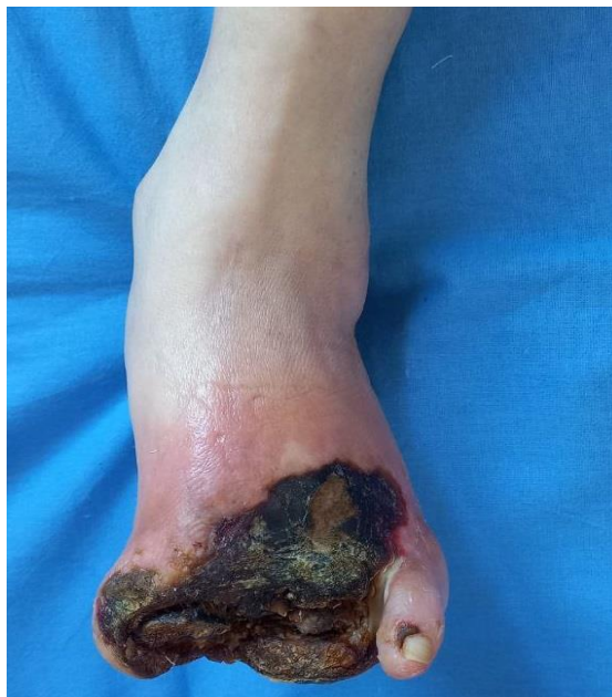
1-расм. Келиб тушган вақтда панжанинг ташқи кўриниши.

Периферик артерияларда қон оқими асосий (магистрал), дуплекс сканирлашни ўтказишида патологиялар аниқланмаган (1-расм).