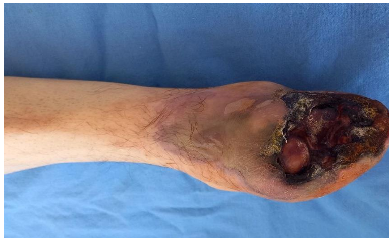
3-расм. Некректомия ва ТЛБАПдан кейин оёқ ҳолати (1,5 ойдан кейин).

ишемия кучайганлиги қайд этилди. УТДГ текишируви панжада коллатерал қон айланиши мавжудлигини кўрсатди (3-расм).