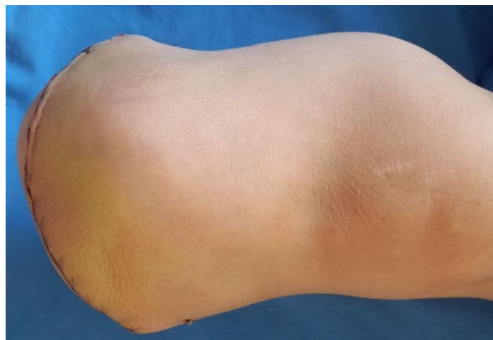
4-расм. Болдир чўлтоғининг операциядан кейинги кўриниши.

Бемор аҳволининг оғирлиги ва тинч ҳолатда оёқларда кучли оғриқ мавжудлиги туфайли юқори ампутацияни амалга ошириши кераклиги тўғрисида қарор қабул қилинди ва 2021 йил 23 ноябрда болдирнинг чап томондан 1/3 қисми даражасида болдир ампутацияси амалга оширилди (3.4-расм).